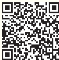
Ссылка на историческую справку