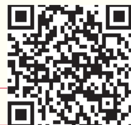
Ссылка на видеореали

Учащиеся ДМШ Яреги – дипломанты Всероссийского фестиваля-конкурса